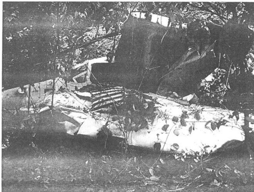
Fig. 1: Destroços da aeronave

A aeronave colidiu contra uma mata no prolongamento da pista do SWFN. Os destroços ficaram concentrados.